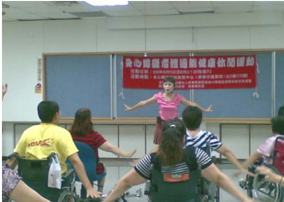
◎身心障礙者體適能健康休閒運動