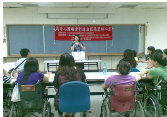
◎為身心障礙者打造自信亮麗的人生研習課程