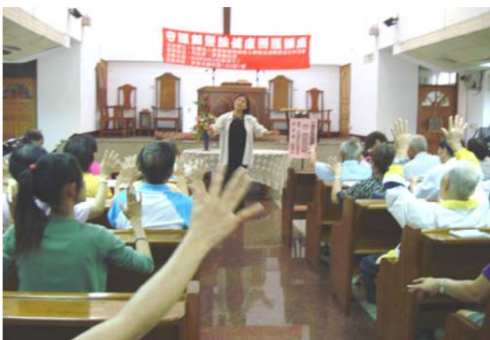
◎守護銀髮族健康照護講座