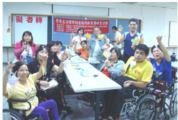
◎響應生活環保創造福利新資源研習