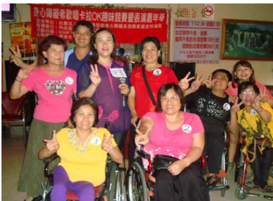
◎身心障礙者歡樂卡拉OK趣味競賽暨表演嘉年華