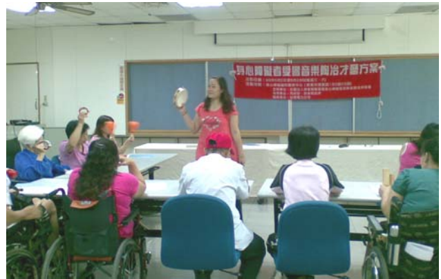
◎身心障礙者愛響音樂陶冶